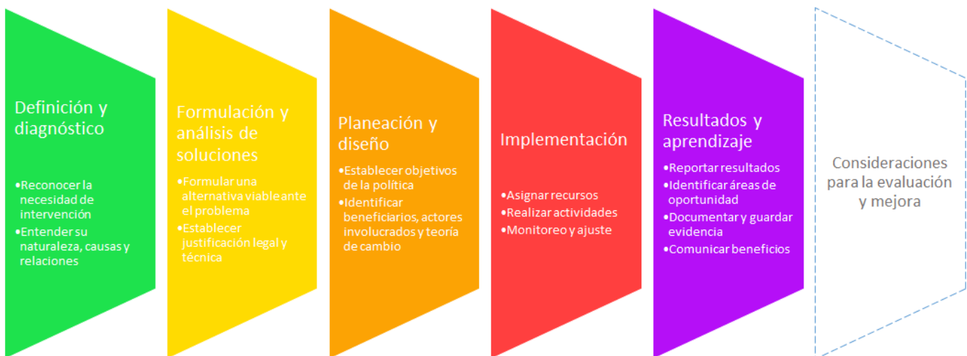
Figura 1. Etapas de las políticas públicas

Es importante anotar que el proceso de política pública no es lineal, sino que más bien es iterativo. Esto quiere decir que durante cada una de las etapas de política pública puede resultar necesario corregir o adaptar ciertos elementos anteriormente desarrollados de acuerdo con los avances y las necesidades de la política. Por esta razón, la metodología propuesta más adelante otorga la flexibilidad